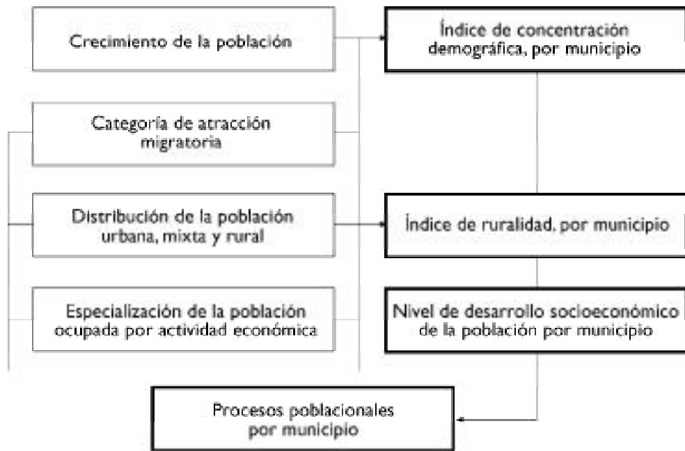
Figura 14.1. Método de obtención del indicador Procesos poblacionales por municipio.

Del examen del conjunto de municipios correspondiente a cada una de las combinaciones, se logra sintetizar la información y agrupar a los municipios en siete nuevas categorías, de tal forma que éstos queden caracterizados como se muestra en el cuadro 14.1.